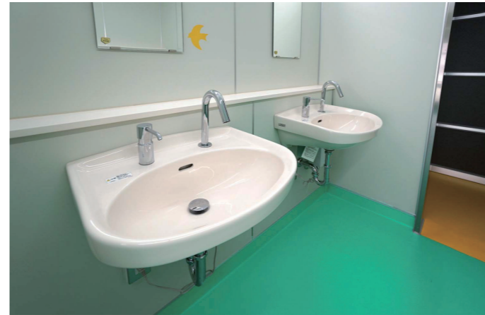
男子トイレ 洗面コーナー

男子トイレは、ビビットなエメラルドグリーンの床に、白い壁にはカラフルな鳥が飛び交い、楽しく明るい空間を演出している。