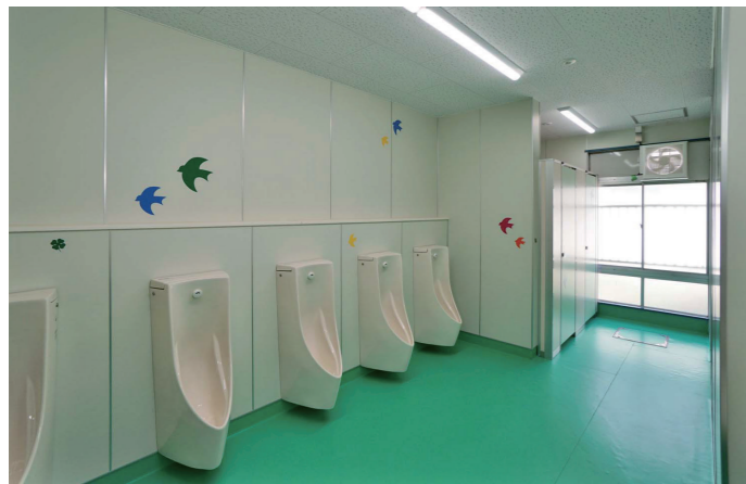
男子トイレ 小便器コーナー