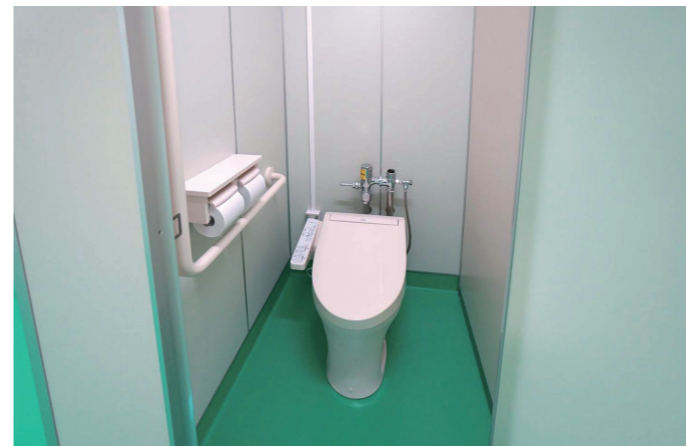
男子トイレ 大便器ブース

使用状況を踏まえ、改修前より器具数を減らし、ブース内の空間を広げた大便器ブース。体格のよい生徒がゆったりと使えるように配慮している。