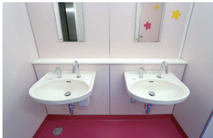
女子トイレ 洗面コーナー

学校は楽しい場所であり、トイレも同様であるべきという考えのもと、つい立ち寄りたくなる学校トイレを演出。自然光が入る大きな窓が活かされ、さらに、LED照明を取り入れた明るい空間には、鳥や花のイラストステッカーがあしらわれている。改修前は和式便器が一部に設置されていたが、改修後はすべての便器を洋式便器に変更。器具数を減らしてブース内の空間を広げることで、体格のよい生徒でもゆったりと使えるように配慮した。また、現在の生活様式にあわせて、家庭での普及率が高いウォシュレットをすべての大便器に設置。加えて、衛生面にも配慮し、洗面コーナーには自動水栓、小便器は床の清掃がしやすい壁掛型の自動洗浄小便器を採用。安心して気持ちよく利用できる、明るく楽しいトイレが完成した。