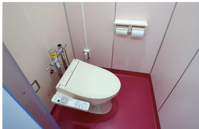
女子トイレ 大便器ブース

女子トイレは、ビビットなルビーレッドの床に、壁面には花のモチーフをあしらった華やかな空間。洗面コーナーに設けたライニングには、手荷物を置くこともできる。