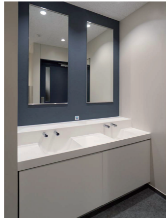
10F男性トイレ 洗面コーナー

手洗い後に肘で押して退出できるような外開きの入口ドアを採用。さらに、トイレの内外にいる人の気配が感じられるよう、すりガラスのスリットドアとしている。