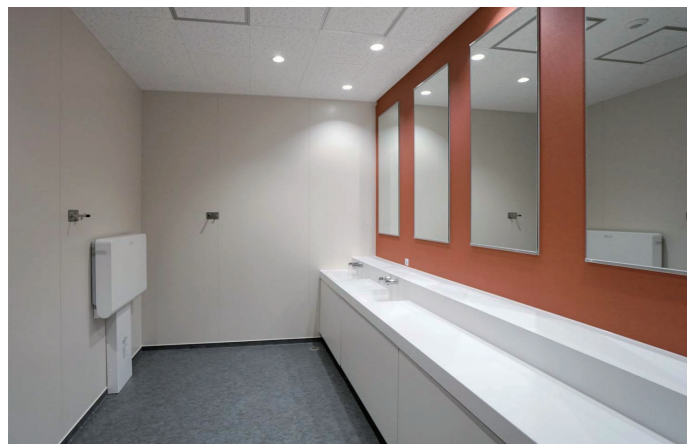
10F女性トイレ 洗面コーナー

大地震や水害発生後、建物が持続可能な中間層柱頭免震構造を採用した。インフラ途絶に対して72時間機能継続が可能なように、発電機、ガラス一体型太陽光パネル、水、排水槽などを設置している。