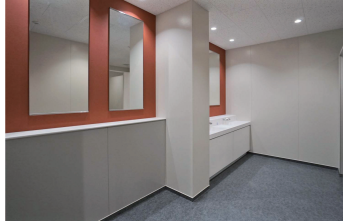
1F女性トイレ スタイリングコーナー

スタイリングコーナーは、隣人の視線が気にならない個別鏡を採用。鏡に近づける奥行きが浅いカウンターや、顔色が明るく映る暖色系の壁にするなど、お化粧直しに配慮している。