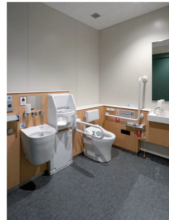
2Fバリアフリートイレ

ドライエリアを設け、荷物の置き場所に配慮したツインデッキカウンターを採用。水栓は、メンテナンスに配慮した壁吐水となっている。また退出時に、身繕いの確認ができる全身鏡を入口に設置している。