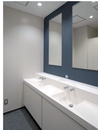
2F男性トイレ 洗面コーナー

ドライエリアを設け、荷物の置き場所に配慮したツインデッキカウンターを採用。水栓は、メンテナンスに配慮した壁吐水となっている。また退出時に、身繕いの確認ができる全身鏡を入口に設置している。