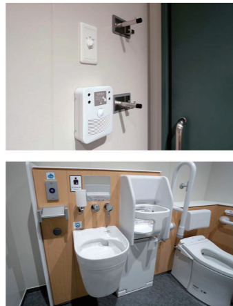
1Fバリアフリートイレ

外国人配慮として、多言語（英語・北京語・台湾語・韓国語・タイ語）の音声ガイドを設置。サインにはピクトグラムを併設し、日本語表記はふりがな付き文字とした。