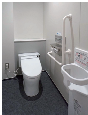
10F女性トイレ 大便器ブース

洗面カウンターの水栓は、非接触で水の出し止めができる壁付自動水栓を採用。洗面コーナーの延長上に、スタイリングコーナーを配置。男性トイレ同様、洗面コーナーにペーパーシートを設置している。