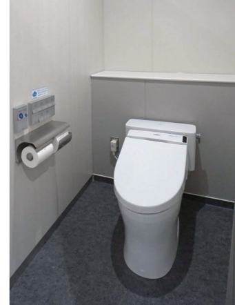
1F女性トイレ 大便器ブース

スタイリングコーナーは、隣人の視線が気にならない個別鏡を採用。鏡に近づける奥行きが浅いカウンターや、顔色が明るく映る暖色系の壁にするなど、お化粧直しに配慮している。