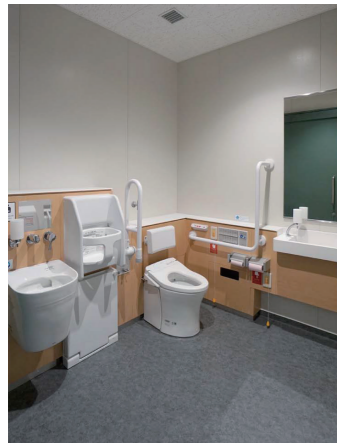
1Fバリアフリートイレ

車いす使用者やお子様連れなど、さまざまな利用者に対応できるコンパクトバリアフリートイレパックを採用。腰壁に色をつけ便器の位置を目立たせる工夫や、大人でも使用できる多目的シートも設置している。