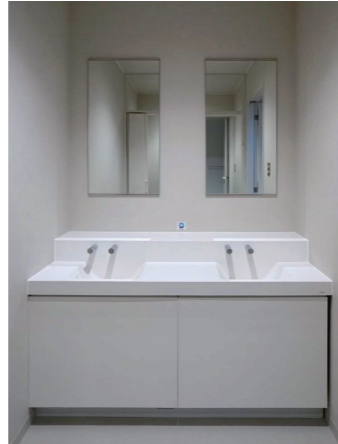
7F休養室 洗面・シャワールーム

職員のための男女別の休養室は、靴を脱いでリラックスできるような床は畳を採用。災害時には、宿直などの利用場面も想定している。