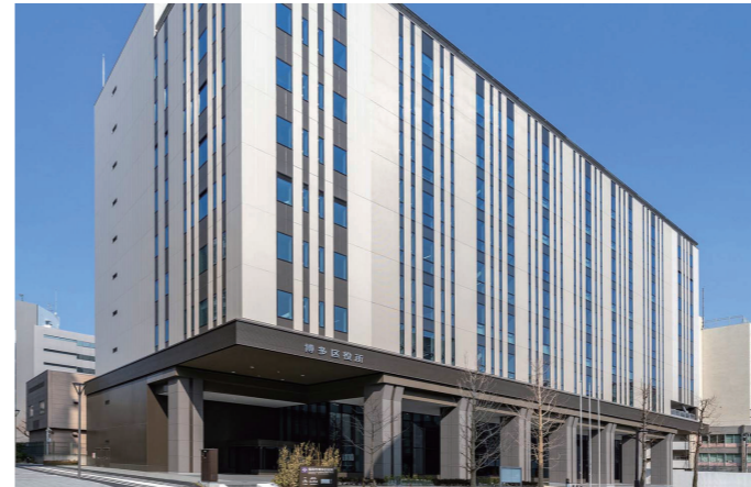
災害時持続可能な 防災拠点

洗面カウンターの水栓は、非接触で水の出し止めができる壁付自動水栓を採用。またお客様連れに配慮し、男性トイレの洗面コーナーにも、ペーパーシートを設置している。