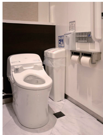
女性トイレ 大便器ブース

すべての大便器ブースには、手すり・ベビーチェアが設置され、女性トイレのひろびろブースにはベビーシートも設置している。