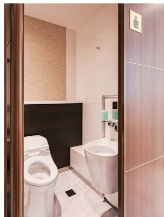
男性トイレ 大便器ブース

小便器は清掃性に優れた壁掛式の自動洗浄小便器を採用。プライバシーに配慮、利用者視点から小便器の間に仕切りを設置している。