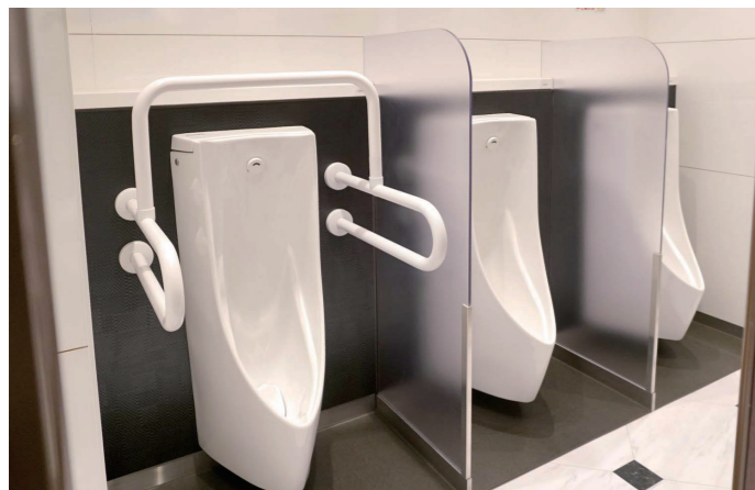
男性トイレ 小便器コーナー

新宿店内の各トイレのファサード意匠にあわせて、清潔感のある意匠へと改装。男女共用で利用できるベビールームの設置やオストメイト配置ブースの導入など機能面の充実にご協力、求められる配慮を1ヶ所に集めてすべてを盛り込んだトイレとなっている。特に、オストメイトは、外見上は見分けが付きにくいことから「多機能トイレが利用づらい」という問題もあり、より利用しやすくするとともに、多機能トイレへの利用集中を緩和している。さまざまな配慮を必要とされる利用者が、広い施設内を探して歩きまわることのないよう、建物の中央に設置しているこのトイレに機能を集めた。