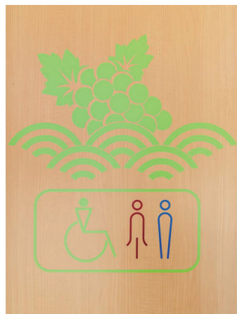
多目的トイレサイン

タンクやバルブのないローシルエットデザインで空間がスッキリ仕上がるウォシュレット一体形便器を採用。衛生面に配慮し、手を洗った後に水栓金具に触れずに自動的に水が止まる、自閉式の水栓を採用している。