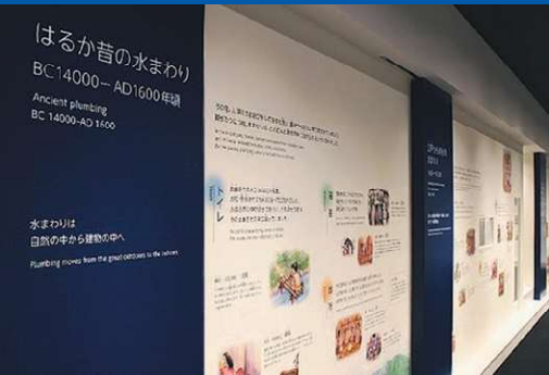
오랜 옛날부터 현재까지 이어져 온 상하수도 시설의 변천사를 소개합니다.

1917년 기타큐슈시 '고쿠라'에서 설립된 TOTO 주식회사. 일본에 아직 하수도가 정비되지 않았던 시절 건강하고 문화적인 생활을 실현하고자 창립되었습니다. 화장실 등 상하수도 시설에 관한 풍부한 자료를 통해 생활 문화의 변천사에 대해 배워봅시다.