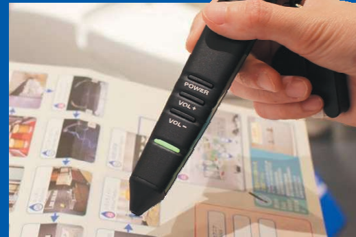
'한국어, 일본어, 영어, 중국어'로 제공되는 음성 가이드 펜을 무료로 대여합니다. ※수량에 제한이 있어 디어가 불가능한 경우도 있습니다.