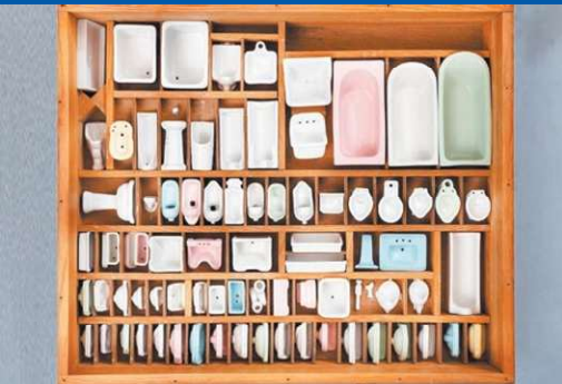
전시장이 없던 시절에 사용된 미니어처 등 귀중한 자료도 전시되어 있습니다.