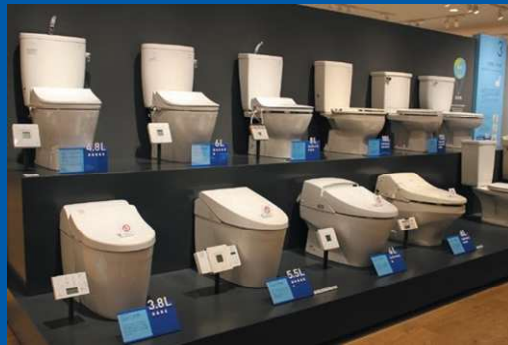
위생 도기나 수도꼭지 등 TOTO 제품의 발전 역사를 한눈에 볼 수 있습니다.