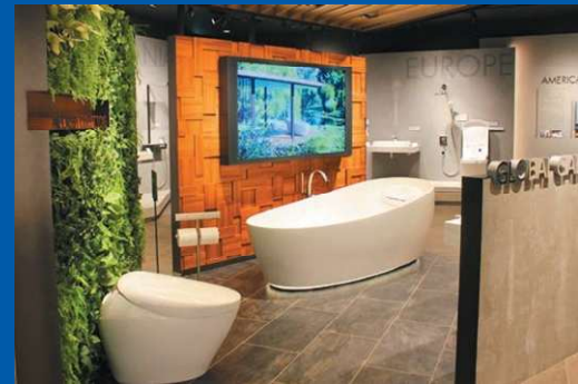
아시아, 미국, 유럽 등 전 세계에서 판매 중인 상품이 전시되어 있습니다.