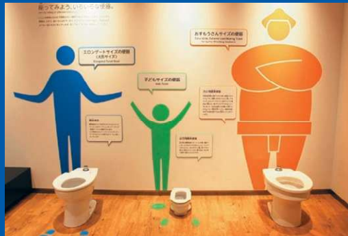
앉아서 체험할 수 있는 전시도 있습니다.