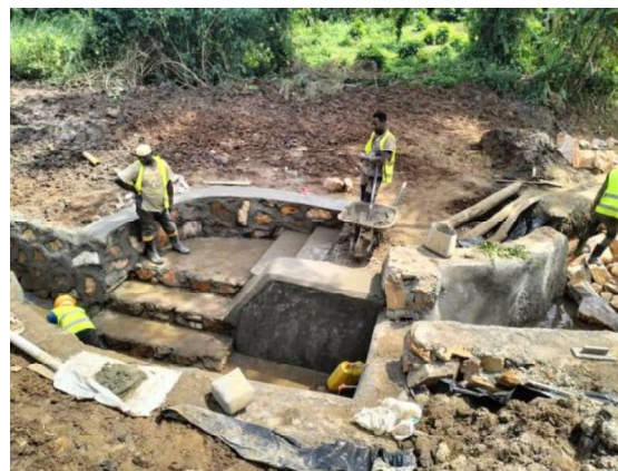
泉を保護・整備する様子(ウガンダ共和国)