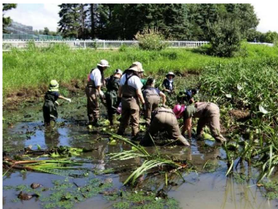
沼の環境整備作業の様子(北海道)

TOTOは創立以来「水」に関わる事業を展開してきた企業として、2030年に「持続可能な社会」と「きれいで快適・健康な暮らし」の実現を目指す、新共通価値創造戦略 TOTO WILL2030のもと、地域社会の発展と地球環境の保護に貢献する活動を積極的に推進することで、国連の「持続可能な開発目標(SDGs)」に貢献し、今後も世界で必要とされ続ける会社を目指します。