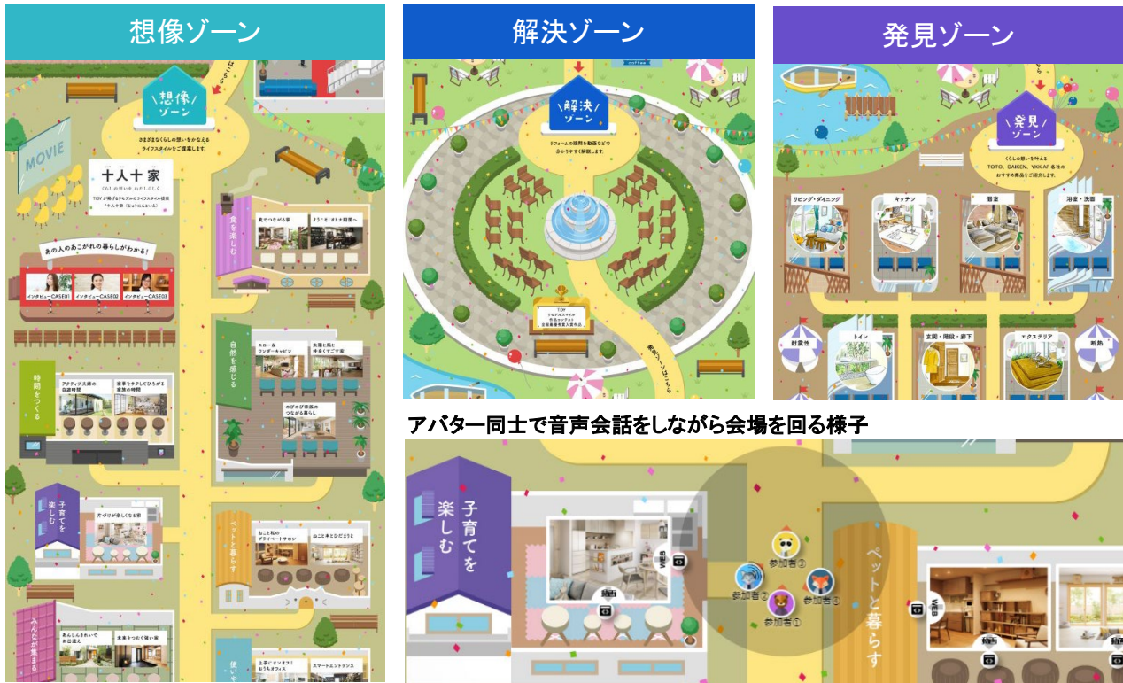
アバター同士で音声会話をしながら会場を回る様子

■オンラインイベント「暮らしかなえる 2022 TDYリモデル博」 https://re-model.jp/special/event/