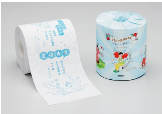
2025年（第21回）発売 トイレトーパー型川柳集