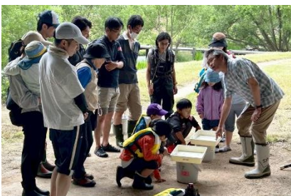
生物観察会の様子(広島県)