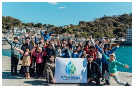
活動後の集合写真(神奈川県)