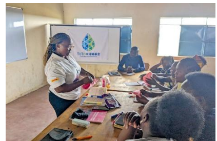
教員への衛生研修(ケニア)