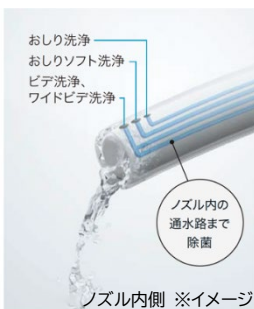
ノズル内側 ※イメージ