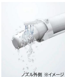
ノズル外側 ※イメージ

トイレ使用後に、「きれいな除菌水」を便座裏の先端部分までふきかけて、汚れをしっかりと漂白・除菌※12。ふだん見えず、汚れに気付きにくい便座裏のきれいが長持ちします。