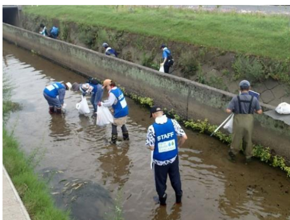
川での清掃活動(岡山)