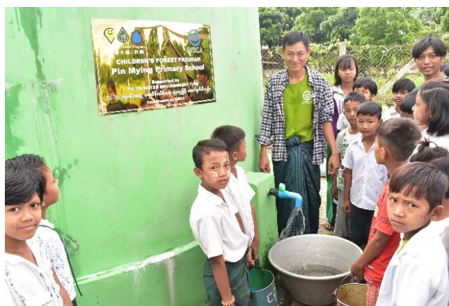
学校に設置した雨水タンク(ミャンマー)