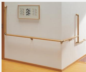
フリースタイル手すり