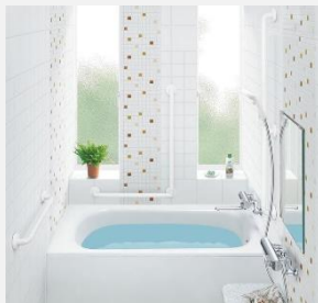
インテリア・バー