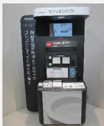
セフィオンテクト