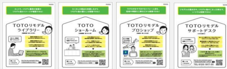
「あんしんリモデル」の4つの取り組みについて