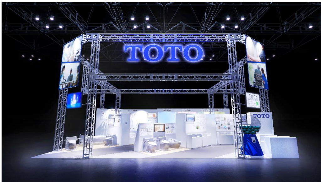
TOTO展示ブースのイメージ

※2:「リモデル」とは、TOTOがリフォームを通して新しい生活スタイルを約束すること