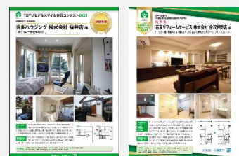
実際のリモデル事例