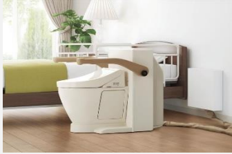
ベッドサイド水洗トイレ