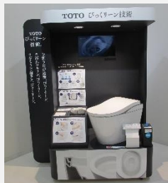
びっくクリーン技術 (使うたび除菌・汚れツルリン・おそうじ超ラク)