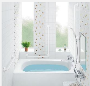
インテリア・バー