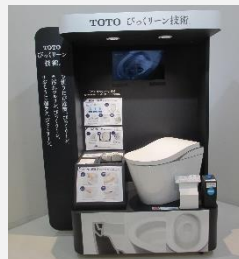
びっくクリーン技術 (使うたび除菌・汚れツルリン・おそうじ超ラク)