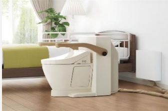
ベッドサイド水洗トイレ