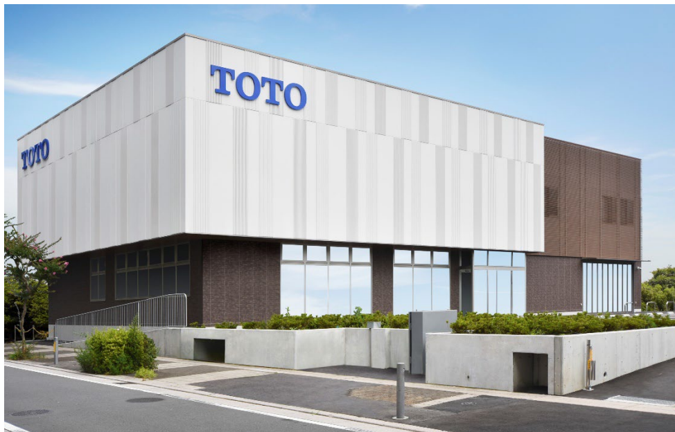
「TOTO横浜港北ショールーム」外観

※2:TOTO がおすすめするあんしん信頼のリフォームネットワークの施工会社です。リモデルプランの提案や施工からアフターサービスまで総合的にお手伝いします。