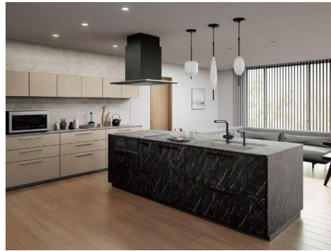
扉カラー: アルディブラック/オーブグレイジュ カウンターカラー: 霞(かすみ)