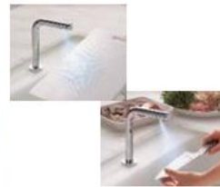
まな板・包丁きれい