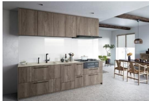
扉カラー: フリミアモカ カウンターカラー: クリスタルグレイジュ キッチンパネル: シンプルホワイトN