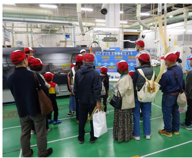
過去の開催の様子