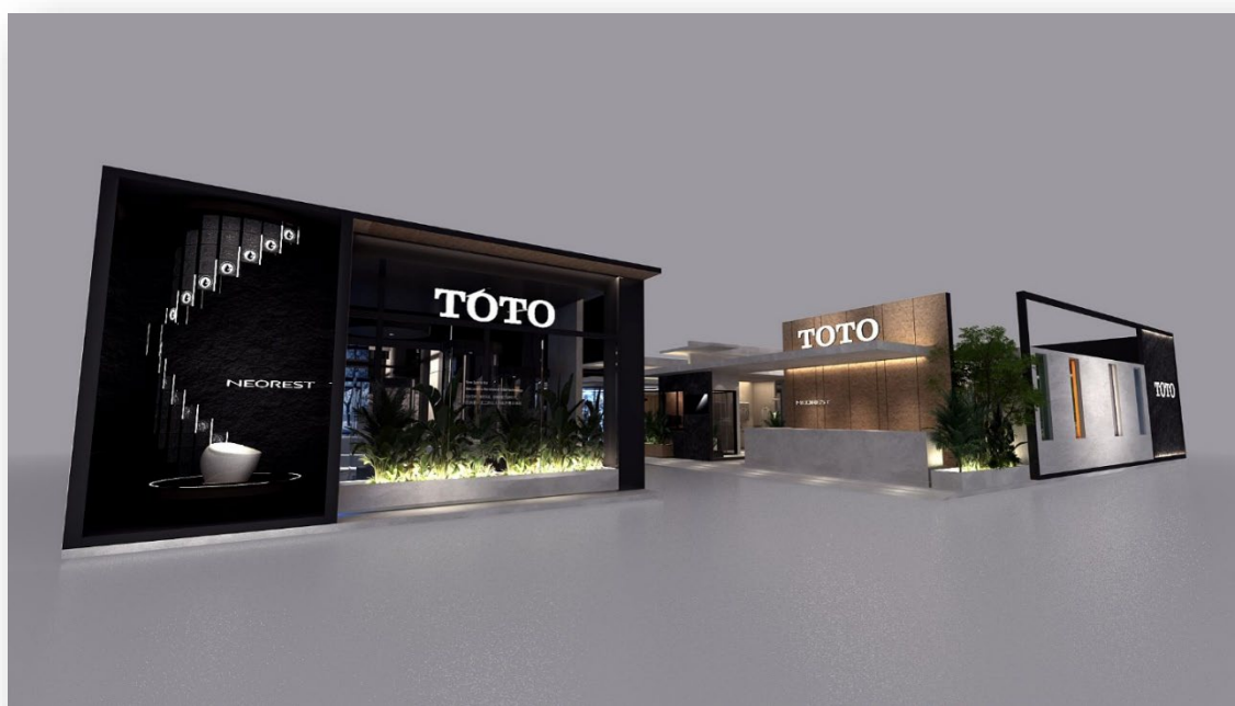
TOTOブースのエントランス(イメージ)

TOTOは、引き続きデザインとテクノロジーの融合を追求し、「きれいと快適・健康」「環境」を両立するTOTOらしい商品をグローバルに普及させることで、「持続可能な社会」、「きれいで快適・健康な暮らし」の実現に貢献していきます。