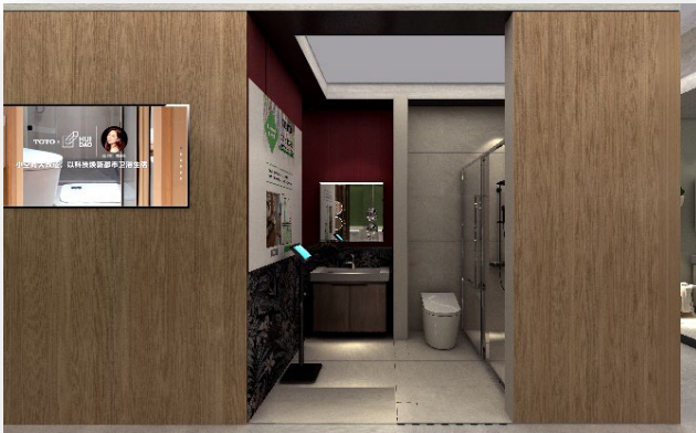
リモデル訴求コーナー(イメージ)