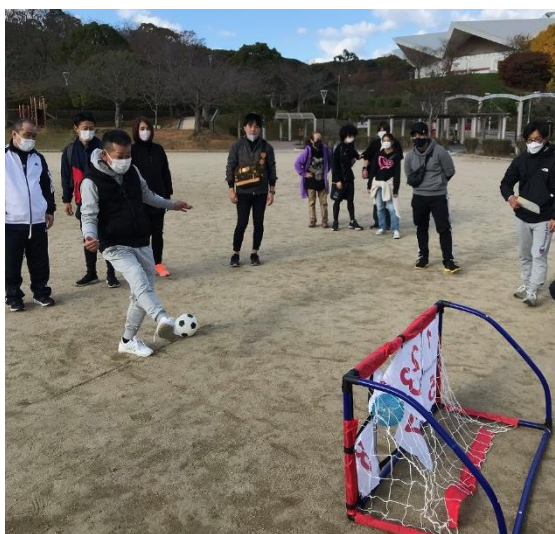
ウォークラリー(ウォーキングイベント)中のゲームイベントの様子