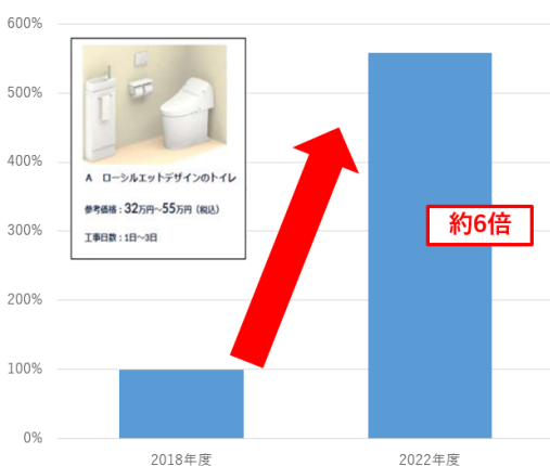
■ 参考価格ページへのアクセス数