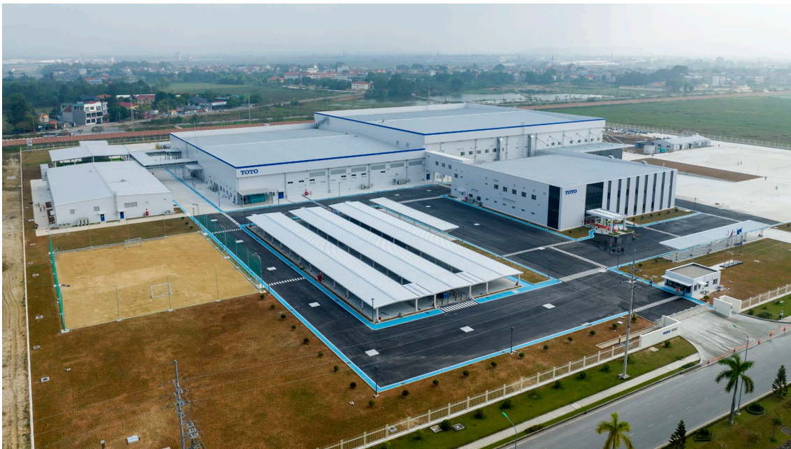
2024年3月から稼働を開始したTOTOベトナム水栓金具工場

※1:クレジット購入によるカーボンオフセットを併用します ※2:TOTOは、「きれいと快適」と「環境」の両立を実現した商品を「サステナブルプロダクツ」と定義し、2030年度に「サステナブルプロダクツ」の商品構成比78%(2020年度69%)をめざしています