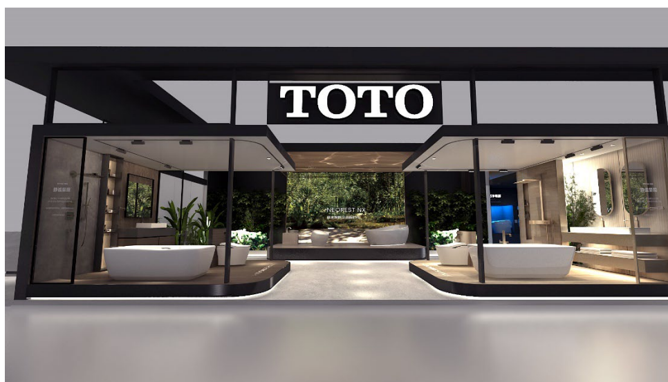
「NEOREST COLLECTIONS」「NEOREST LS」の展示コーナー(イメージ)

※3: 「ウォシュレット」「WASHLET」は、TOTO株式会社の登録商標です。