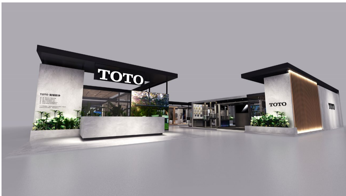
TOTOブースのエントランス(イメージ)

※2: 「CLEAN(クリーン)」と「INNOVATION(イノベーション)」をモチーフにした造語。