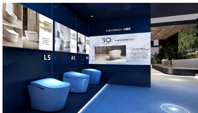
技術・デザインの展示コーナー(イメージ)