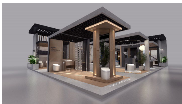
空間展示のコーナー(イメージ)

今回の展示ブースでは、これまで以上に空間展示を充実させ、TOTOだからこそ実現できる、水まわりにおける新しく豊かなライフスタイルを提案します。また、給水管やコードを外から見えなくし、周囲と調和するデザインである海外向けの商品「WASHLET+」も展示します。