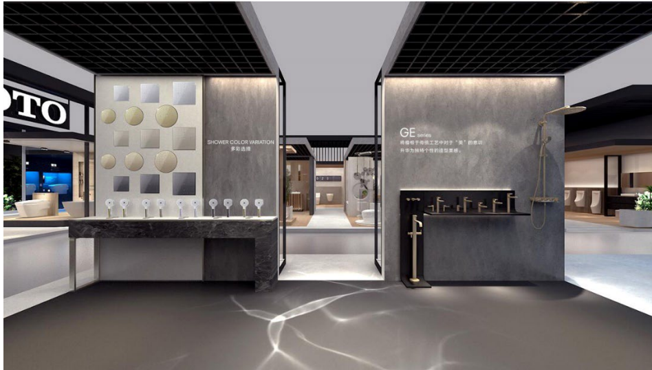
水栓のCMF展示のコーナー(イメージ)

また、海外のバスルーム空間では、水栓は品位や彩りをもたらす重要なアイテムとして、形状はもとより、表面のCMF[Color(色)／Material(素材)／Finish(表面加工)]まで含めた高いデザイン性が求められることから、このようなニーズにお応えする豊富な品揃えを紹介します。