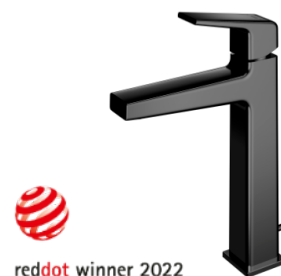
マットブラック表面仕上げ

※7： Physical Vapor Deposition の略。イオン化した原料とガスを化学反応させ、加工物へ色膜を形成する加工。