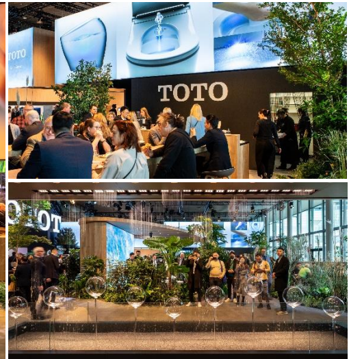
(上)ラウンジの様子