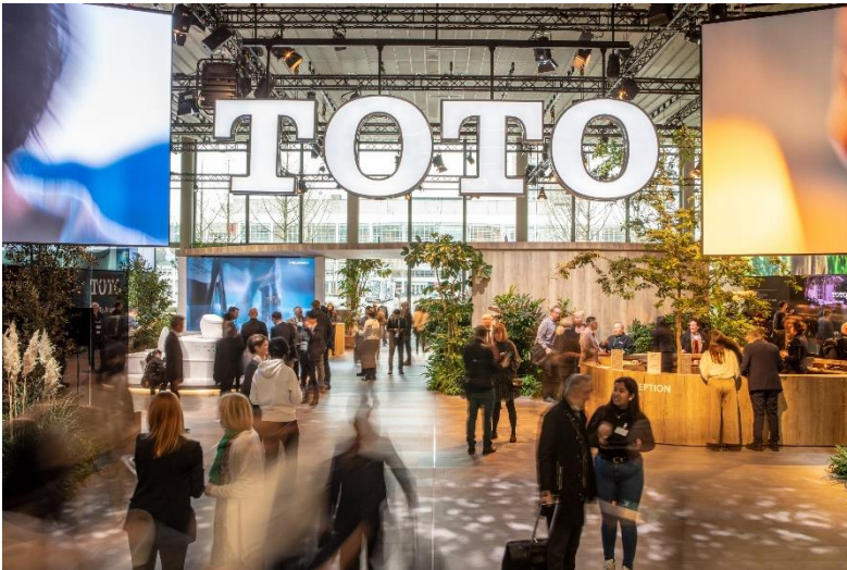
エントランスの様子

TOTOの出展は2009年の初出展から今回で8回目となり、4年ぶりのリアル開催となりましたが、世界各国からの多くの来場者に、TOTOだからこそ実現できる、水まわりにおける新しく豊かなライフスタイルの提案を見ていただくことができました。TOTOはこれからも、環境に配慮しながらきれいさと快適さを追求した商品を提供し続け、豊かで快適な社会の実現に貢献していきます。