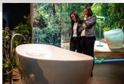
NEOREST NX コレクションズ