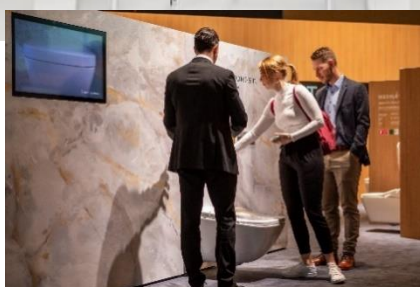
NEOREST WX 展示