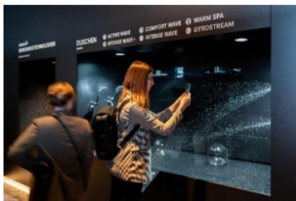
テクノロジー展示

展示には、生活価値を感じることのできる空間から、商品・技術を紹介するコーナーを設けました。中でも、今回参考出品し、初お披露目となった「ネオレストWX」の展示には絶え間なく人が訪れていました。