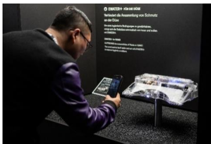
テクノロジー展示