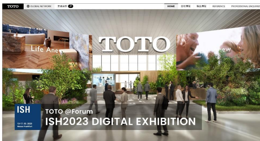
TOTOグローバルサイト「ISH展示会ページ」バナー