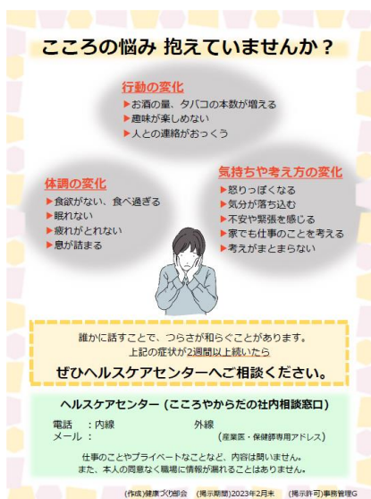
トイレに掲示しているポスター