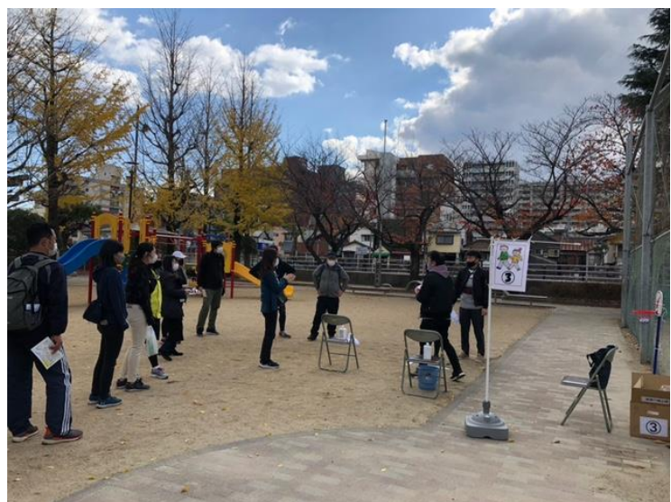
ウォークラリー(ウォーキングイベント)