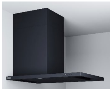
ブラック(つや消し)