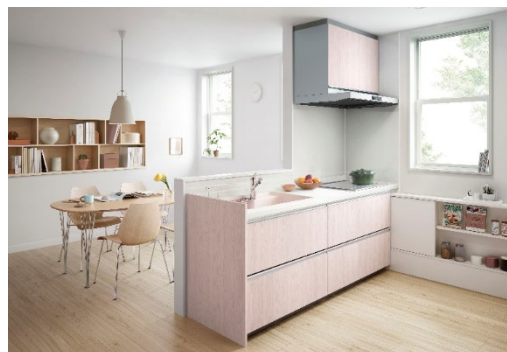
[扉カラー:ボルケピンク]