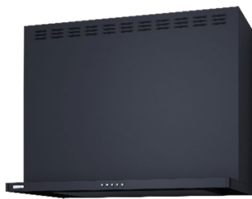
ブラック(つや消し)