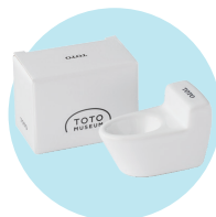
超ミニチュア便器