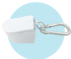
ネオレストキーホルダー